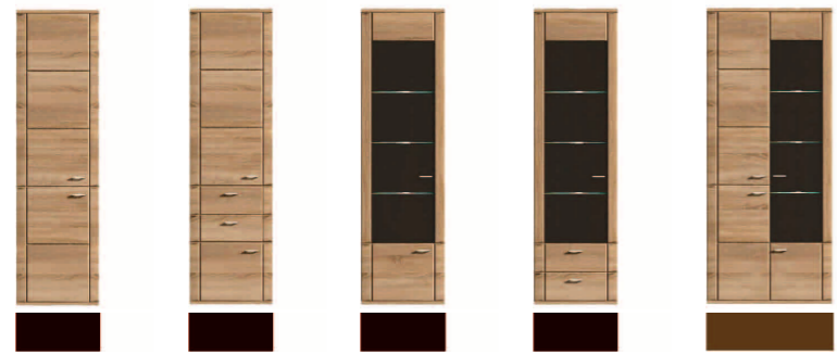
1746 (L) 1747 (R) 60 / 215 / 39 1748 (L) 1749 (R) 60 / 215 / 39 1750 (L) 1751 (R) 60 / 215 / 39 1752 (L) 1753 (R) 60 / 215 / 39 1754 (L) 1755 (R) 90 / 215 / 39 1756 1757 90 / 215 / 39