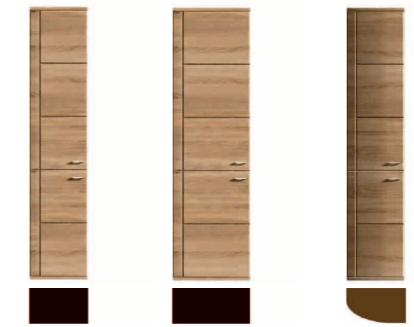
1742 (L) 1743 (R) 45 / 215 / 39 1744 (L) 1745 (R) 60 / 215 / 39 1782 (L) 1783 (R) 45 / 215 / 39