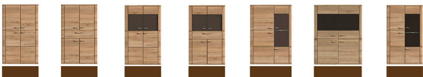
1660 90 / 152 / 39 1661 90 / 152 / 39 1662 90 / 152 / 39 1663 90 / 152 / 39 1664 (L) 1665 (R) 105 / 152 / 39 1666 120 / 152 / 39 1668 (L) 1669 (R) 90 / 152 / 39

Aufsatz, Zwischenbau- und Hänge- Elemente