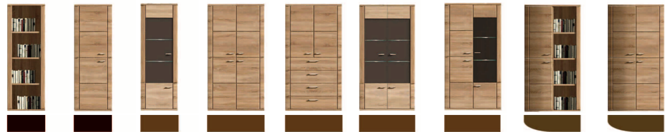
1710 60 / 173 / 39 1716 (L) 1717 (R) 60 / 173 / 39 1718 (L) 1719 (R) 60 / 173 / 39 1720 90 / 173 / 39 1721 90 / 173 / 39 1722 90 / 173 / 39 1728 (L) 1729 (R) 90 / 173 / 39 1734 (L) 1735 (R) 90 / 173 / 39 1736 (L) 1737 (R) 90 / 173 / 39