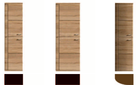
1712 (L) 1713 (R) 45 / 173 / 39 1714 (L) 1715 (R) 60 / 173 / 39 1732 (L) 1733 (R) 45 / 173 / 39