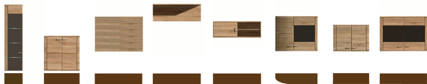
1672 (L) 1673 (R) 45 / 167 / 39 1676 90 / 86 / 39 1678 120 / 83 / 2 1680 120 / 42 / 39 1681 120 / 42 / 33 1682 (L) 1683 (R) 105 / 89 / 39 1684 90 / 68 / 39 1686 120 / 89 / 39

Aufsatz, Zwischenbau- und Hänge- Elemente