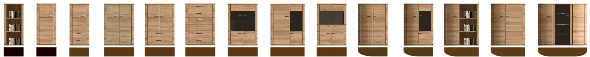
1635 60 / 132 / 39 1636 (L) 1637 (R) 60 / 132 / 39 1638 (L) 1639 (R) 60 / 132 / 39 1640 90 / 132 / 39 1641 90 / 132 / 39 1642 90 / 132 / 39 1643 90 / 132 / 39 1644 (L) 1645 (R) 105 / 132 / 39 1646 90 / 132 / 39 1650 (L) 1651 (R) 90 / 132 / 39 1652 (L) 1653 (R) 90 / 132 / 39 1654 (L) 1655 (R) 105 / 132 / 39 1656 (L) 1657 (R) 105 / 132 / 39 1658 150 / 132 / 39