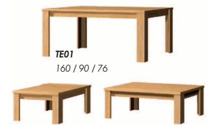
TE01 160 / 90 / 76 TC01 60 / 60 / 43 TC02 120 / 60 / 43